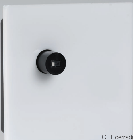
CET cerradura taquilla