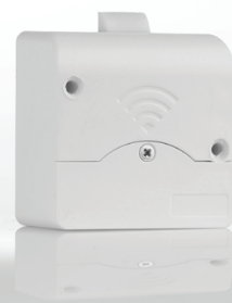
CEM cerradura taquilla